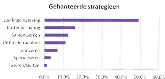
Afbeelding 2 Volgorde gehanteerde strategieën

Wat doen scholen als reactie op de krimp van de bevolking? De respondenten gaven in totaal zeven strategische mogelijkheden om te reageren. Afbeelding 2 laat zien welke strategieën het meest werden genoemd.